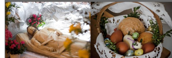
Adoracja Grobu Pańskiego: